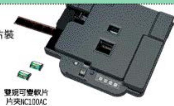
雙規可變軟片 片夾NC100AC

雙規可變軟片片夾可以處理APS軟片及135軟片, 讓軟片裝填更容易, 並可自動進行“ONE PASS”處理。